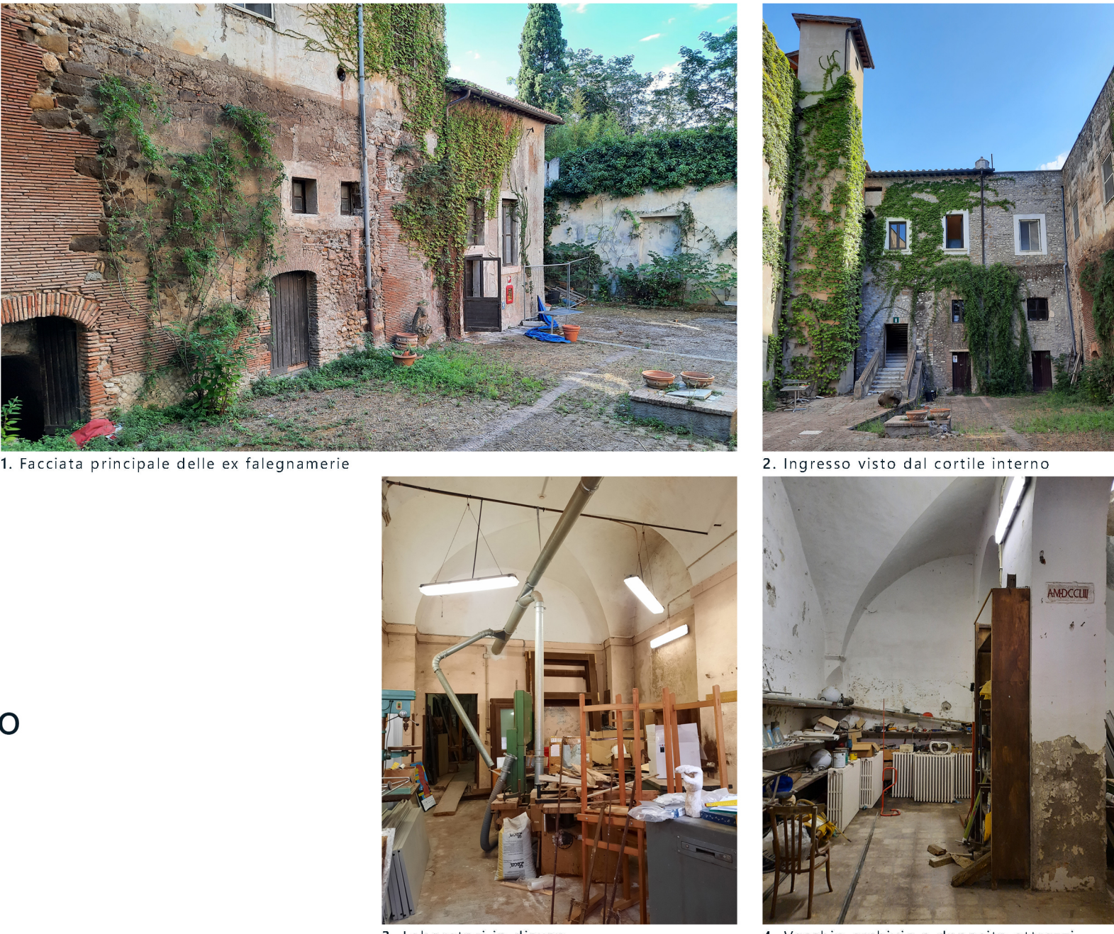
1. Facciata principale delle ex falegnamerie