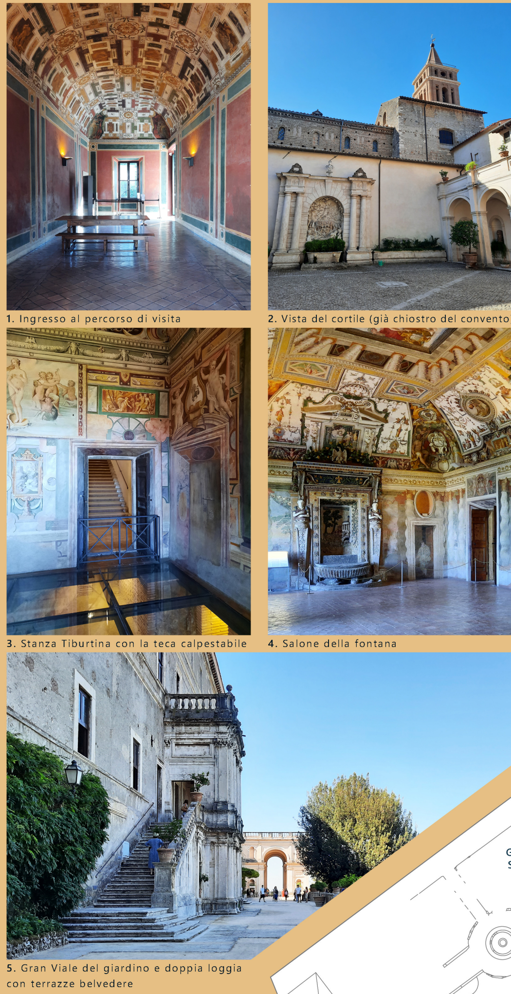
5. Gran Viale del giardino e doppia loggia con terrazze belvedere